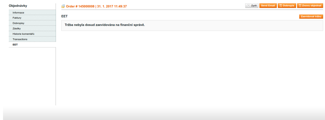
Obrázek 4.1. Detail objednávky

Při úspěšné registraci tržby je zobrazen stav na detailu objednávky.